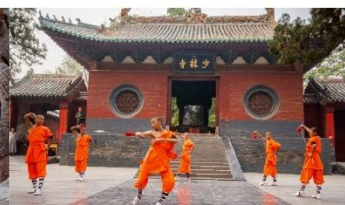
ชมโชว์กังฟูเส้าหลิน

*ทางบริษัทฯ ขอสงวนสิทธิ์ในการสลับโปรแกรมทัวร์ตามความเหมาะสมขึ้นอยู่กับสถานการณ์หน้างาน โดยคำนึงถึงผลประโยชน์ของลูกค้าเป็นสำคัญ