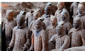
สุสานทหารจีนซี