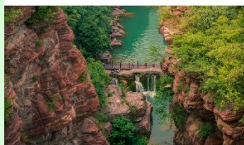
อุทยานสวรรค์หยุนโตซาน