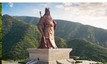
บ้านเกิดท่านกวนอู