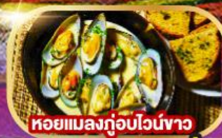
หอยแมลงภู่อบไวน์ขาว