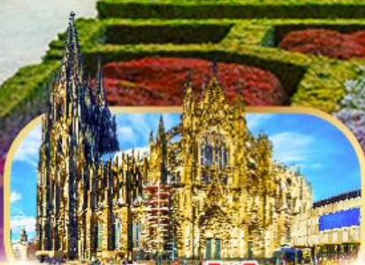
มหาวิหารโคโลญ