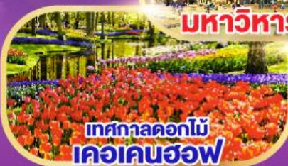
เทศกาลดอกไม้ เคอเคนฮอฟ