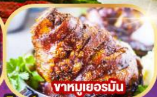
ขาหมูเยอรมัน

พิเศษ!! เมนูหอยแมลงภู่อบไวน์ขาวและขาหมูเยอรมัน