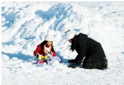
Playing in the snow