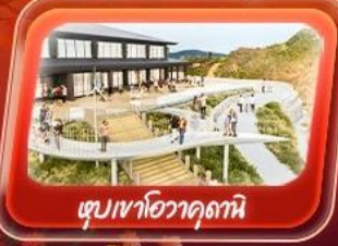
ชมเขาโอวาคุดานิ