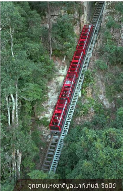
อุทยานแห่งชาติบูลเมาก์เกนส์, ซิดนีย์