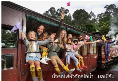
ขบวนรถไฟหิมะร้อน, เมลเบิร์น