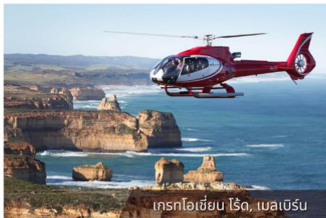
เฮลิคอปเตอร์, เมลเบิร์น