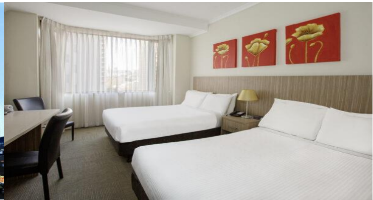
(โรงแรมย่านใจกลางเมือง ใกล้แหล่งช้อปปิ้ง เดินทางสะดวก)