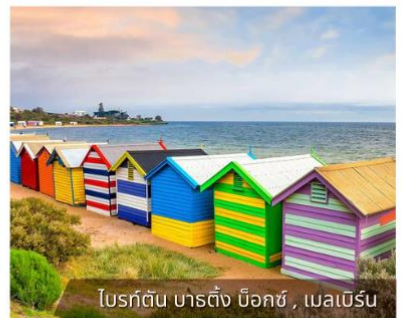
โบรท์ตัน บาร์ติง บ็อคซ์, เมลเบิร์น