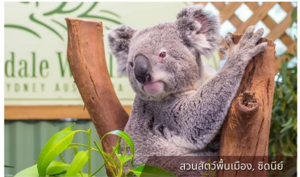
สวนสัตว์พื้นเมือง, ซิดนีย์