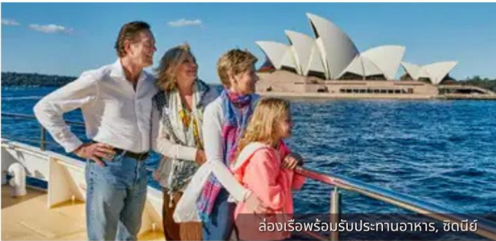
ล่องเรือพร้อมรับประทานอาหาร, ซิดนีย์