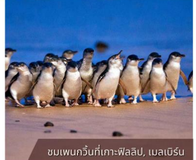
ชมเพนกวินที่เกาะฟิลลิป, เมลเบิร์น